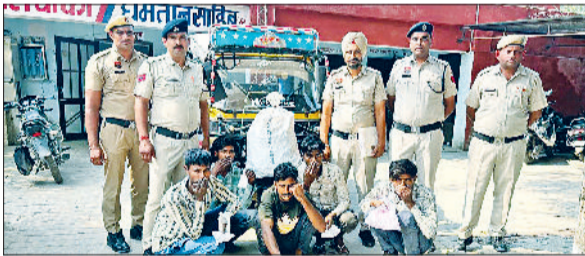
जींद। पुलिस गिरफ्त में आरोपित।