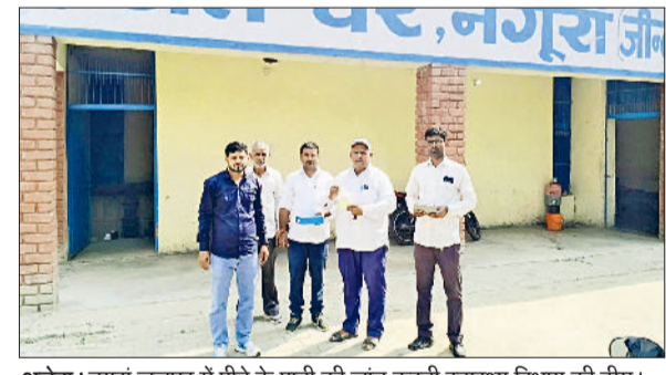
अलेवा। नग्रां जलघर में पीने के पानी की जांच करती स्वास्थ्य विभाग की टीम।