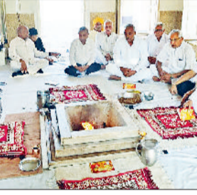
नरवाना। यज्ञ में आहुति डालते हुए।