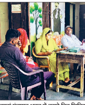
नग्रां पंचायत भवन में दूसरे दिन शिविर में रजिस्ट्रेशन करवाती पात्र महिलाएं।