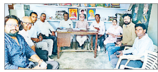
जींद। बैठक में भाग लेते संस्था सदस्य।