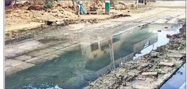
कैथल। वजीरनगर को बालू गांव से जोड़ने वाली सड़क पर जमा पानी।

ग्रामीणों ने बताया कि शिकायत के बाद ग्राम पंचायत यहां नालियों की कुछ हद तक सफाई करवा देती है। जबकि सड़क लोक निर्माण विभाग के अंतर्गत आती है। जिस वजह से वो भी इसके साथ ज्यादा छेड़छाड़