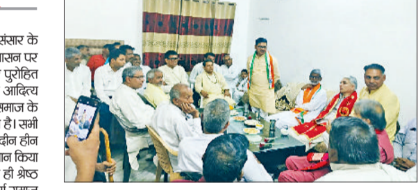
जींद। पीएम के मन की बात कार्यक्रम को सुनते भाजपा कार्यकर्ता।