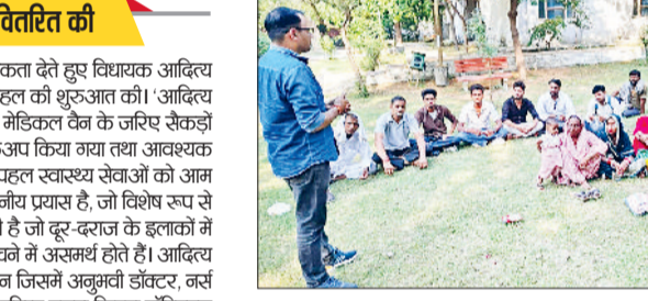
जवाहर पार्क में लोगों को साइबर जागरूकता की जानकारी देते पुलिस कर्मचारी।