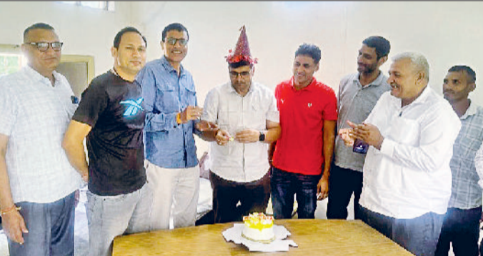
पुलिस लाइन्स में सह कर्मी का जन्मदिन मनाते राज्य अपराध शाखा के अधिकारी एवं कर्मचारी।