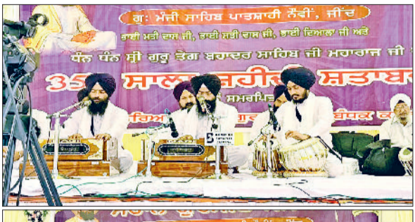
जींद। गुरु की महिमा का बखान करते रागी जत्था।