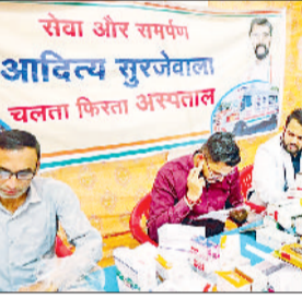
कैथल। शिविर में मरीजों की जांच करते चिकित्सक।