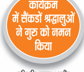
हरिभूमि न्यूज ॥ जींद

गुरु तेग बहादुर का 350 साला शहीदी दिवस को समर्पित महान गुरुमत समागम श्रद्धा से मनाया