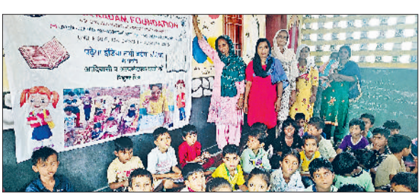
जींद। बच्चों के साथ सदस्य।